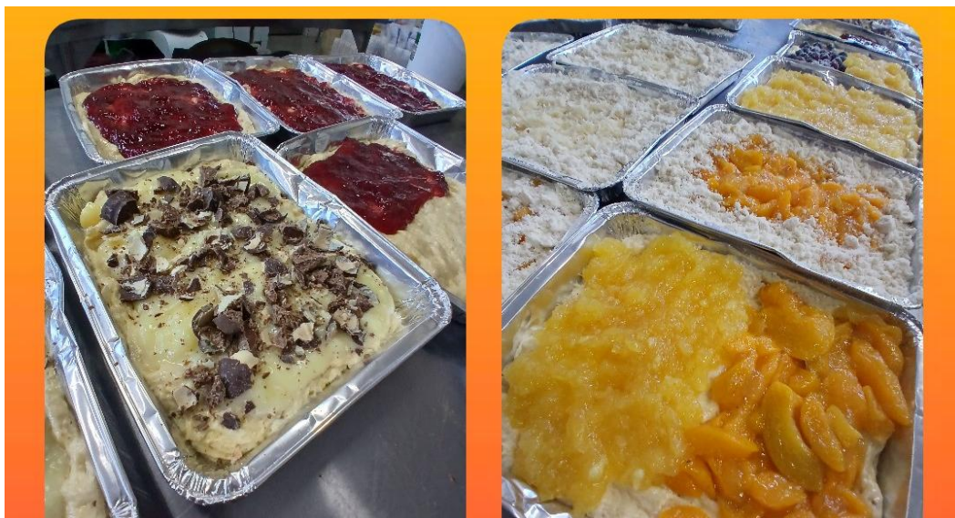
Tradicional cuca alemã - produção: Padaria Avenida

A gastronomia é um dos quesitos que melhor ilustram a rica identidade do povo paraisense e constitui um forte fator de atração de visitantes. Desta forma, é preciso apoiar a ampliação da comercialização e consumo das ofertas dos produtos e experiências de turismo gastronômico em nossa cidade.